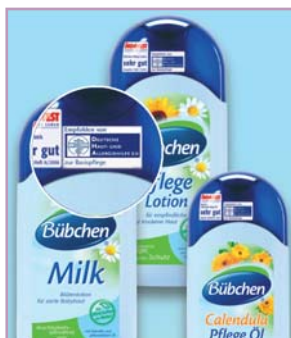
Von der DHA getestet und empfohlen

hautverträglich und hinsichtlich ihrer Pflegeeigenschaften als sehr wirkungsvoll erwiesen haben.