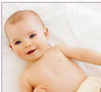
Abhängig vom aktuellen Krankheits-schub und Hautzustand benötigt die neurodermitiskranke Haut sowohl Basispflege wie Therapie.

Bei den meisten Kindern klingen die Beschwerden bis zum Erwachsenenalter ab. Rund ein Viertel der Betroffenen leidet jedoch ein Leben lang unter unregelmäßig auftretenden, mal stärker, mal schwächer ausgeprägten Neurodermitisschüben.