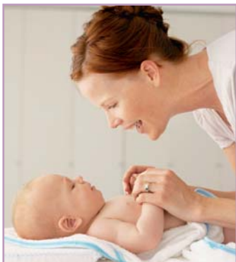
Die Haut ist Sinnesorgan und Schutzhülle zugleich.

Ein kleiner Mensch hat das Licht der Welt erblickt und nimmt Kontakt mit seiner Umwelt auf. Zärtliches Streicheln und Liebkosungen werden zu seinen ersten Eindrücken und Erfahrungen gehören. Denn während sich alle anderen Sinne erst nach und nach ausprägen und schärfen, ist die Wahrnehmung über die Haut von Anfang an gegeben. Ihr Baby wird gleich nach der Geburt Berührungen, Kälte und Wärme spüren. Doch es sind nicht allein die ersten Sinneseindrücke, die die Haut des